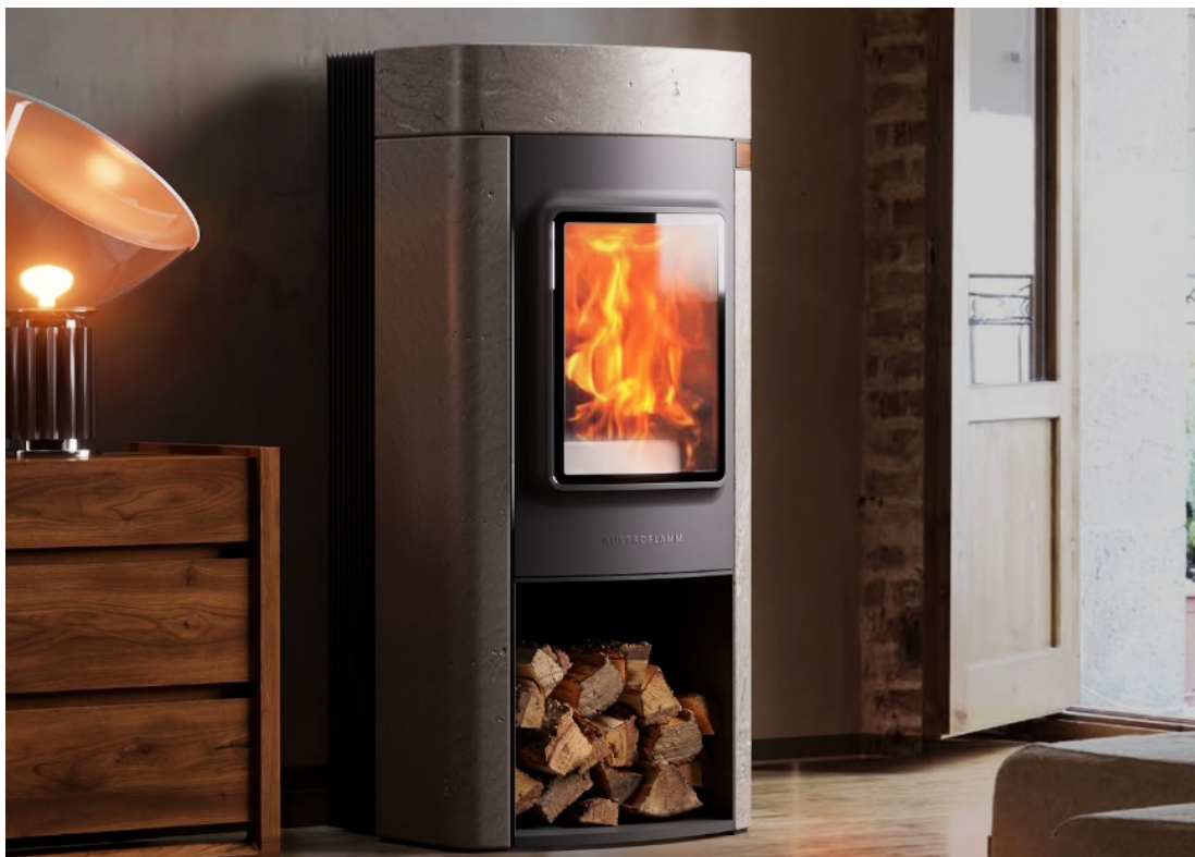
versione pietra ollare