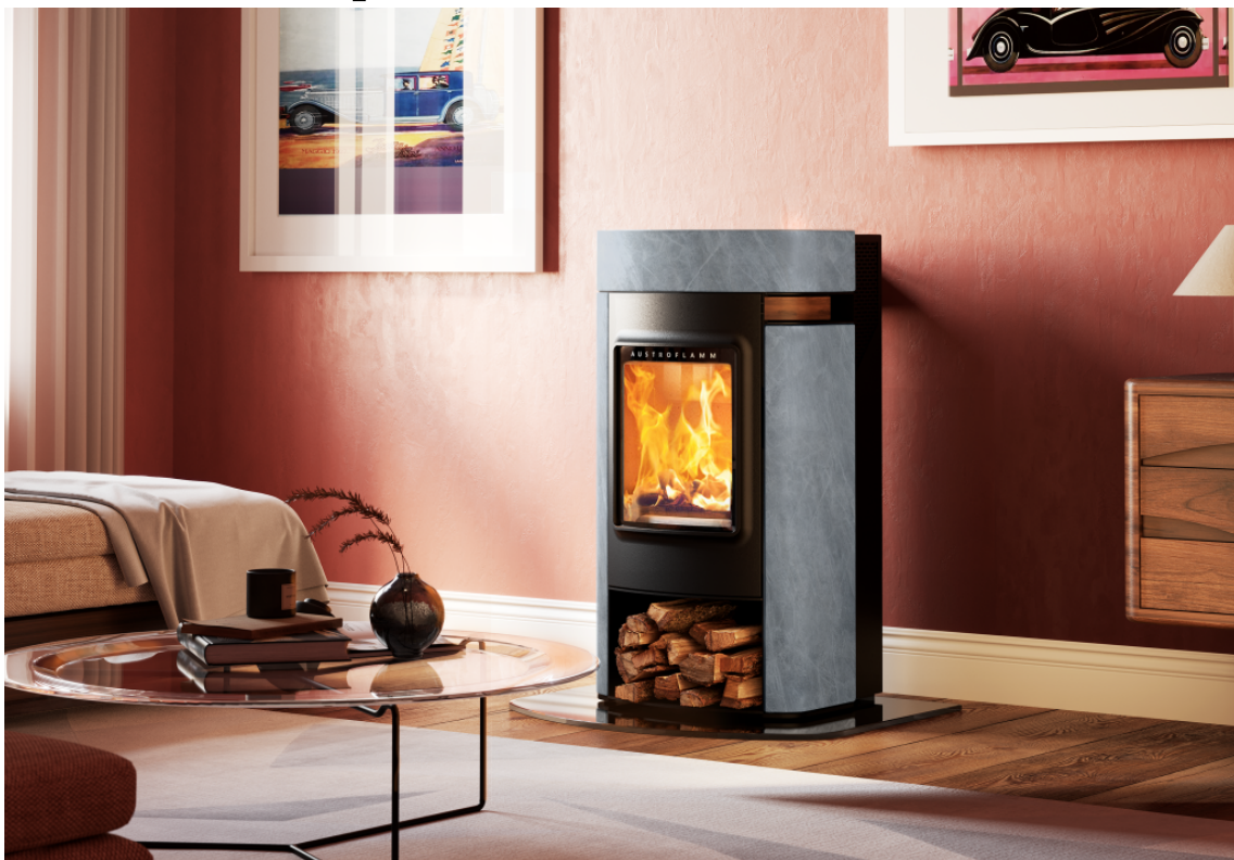
versione pietra ollare